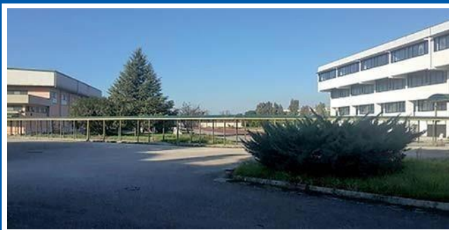
Liceo Scientifico "Edoardo Amaldi"